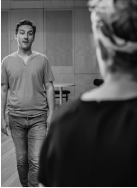
Répétitions à la Philharmonie de Paris Juillet 2020