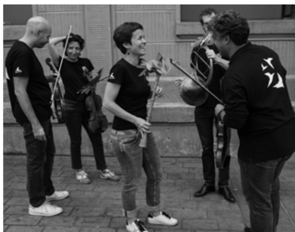
Représentation en plein air, esplanade Nathalie Sarraute, Paris XVIII Juillet 2020